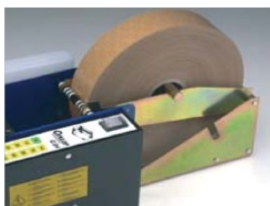
Adaptador rollos grandes (hasta 300 mm de diámetro)