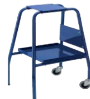
Mesa / carrito (con estante para colocar las bobinas de precinto)