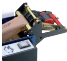
Rodillo impresor (para codificar y dispensar el precinto al mismo tiempo (fechas, números, etc.))