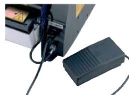
Pedal (facilita el trabajo del operario, ya que tendrá las manos libres)