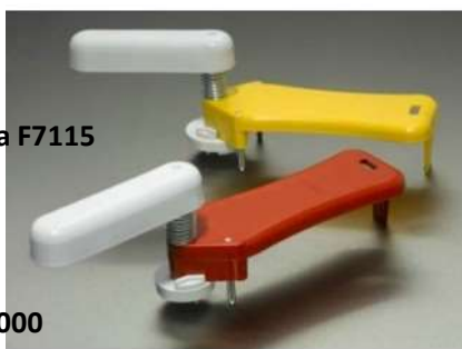
16F700L Roja F7000