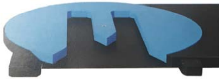
PLATAFORMA CON ENTRADA PARA TRANSPALETA (OPCIONAL)