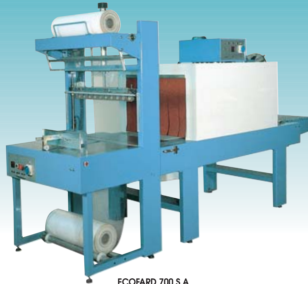
ECOFARD 700 S.A.