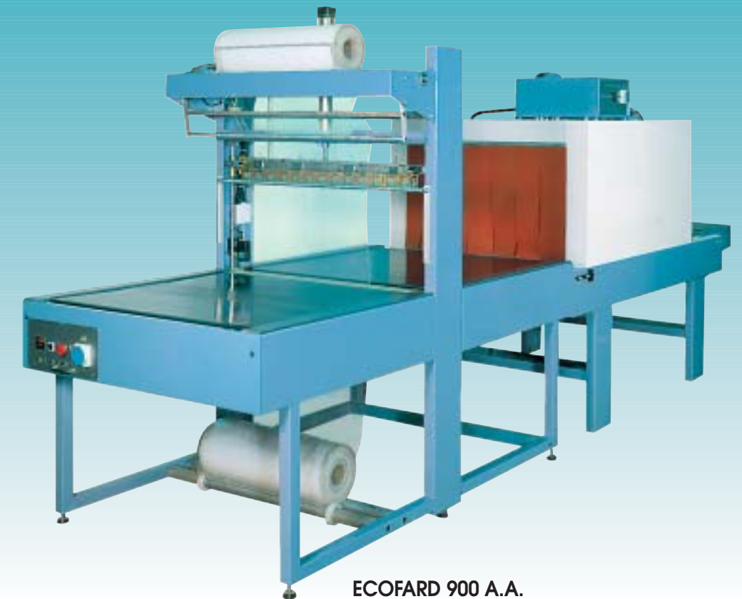
ECOFARD 900 A.A.

LA RISPOSTA PIÙ COMPLETA A OGNI PROBLEMA DI AFFARDELLAGGIO - THE RIGHT ANSWER TO EVERY PROBLEM IN SLEEVE PACKAGING