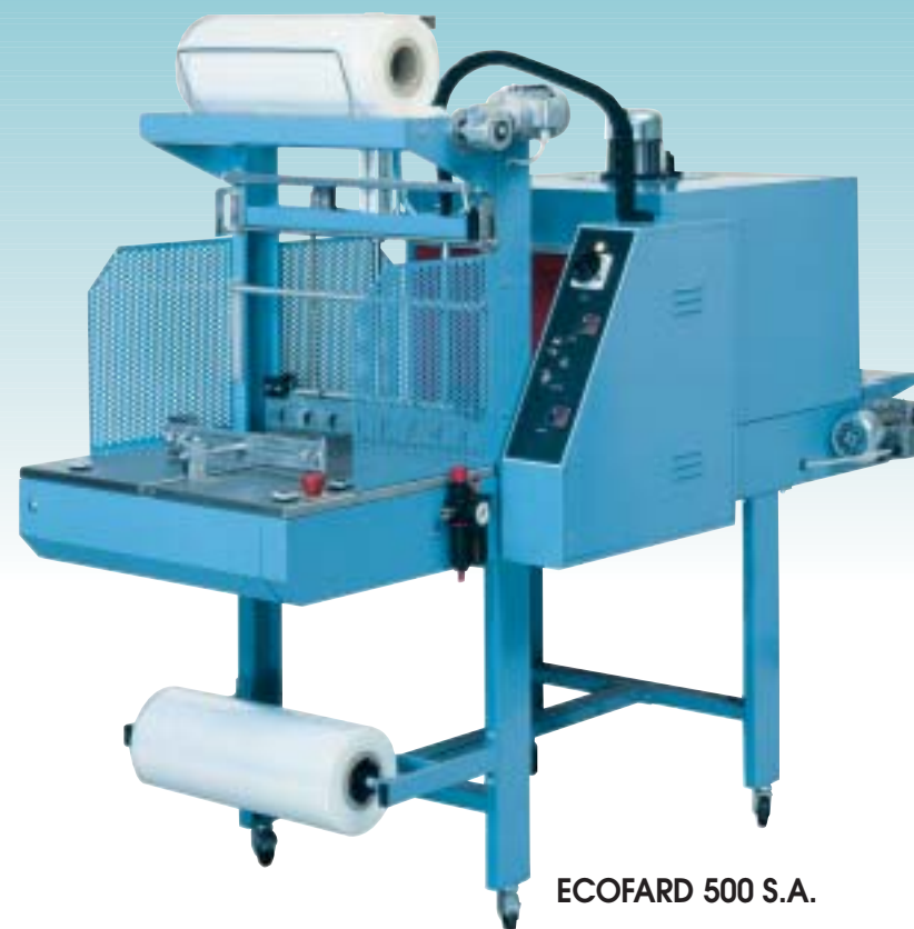
ECOFARD 500 S.A.

email comercial@rozagrapi.com email asturias@rozagrapi.com