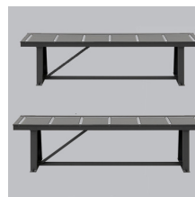
» Caminos de rodillos