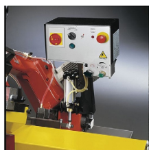
» Bajada controlada