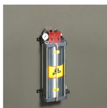
» Dispositivo de corte en seco