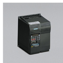
» Variador electrónico