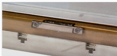
LMC-300 + bandeja de apoyo