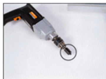
• Broca de acoplamiento taladro/cabezal.