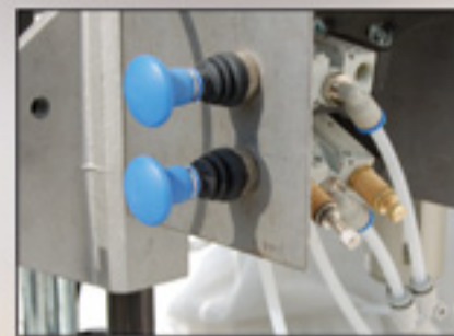
• Mandos de los prensos.