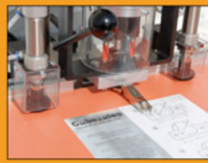
• Inserción semi automatica de las bisagras. Muy preciso y rapido.