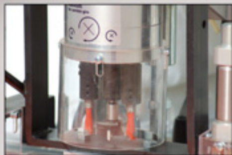
• Nueva protección de cabezal