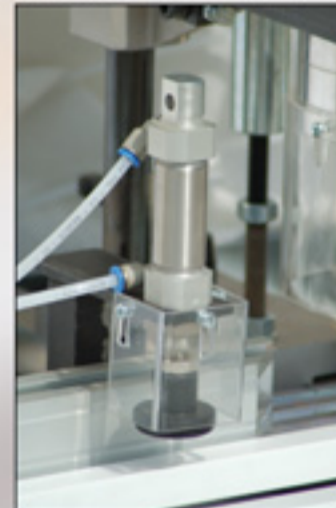
• Prensos neumaticos.