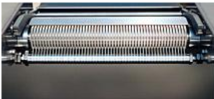
Rodillo de transporte con peine rascador (Tecnología CF)