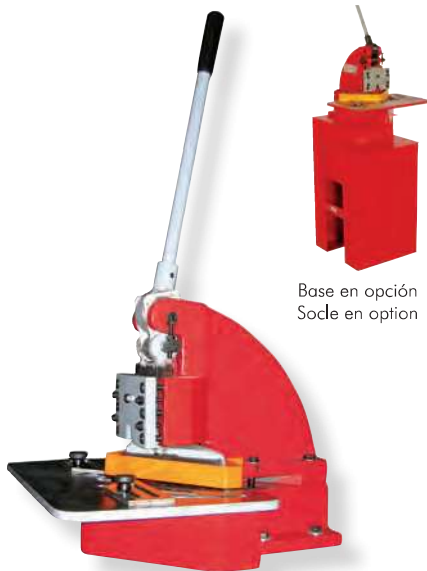
Base en opción Socle en option