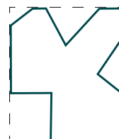
Ejemplos formas Exemples formes