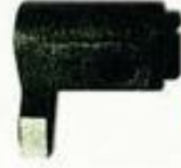
243071 Casquillo eje engrazador.