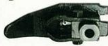
242231A Conjunto de sujeción pie.