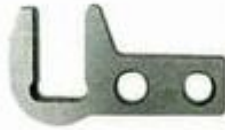
246011 Soporte extensión cuchilla.