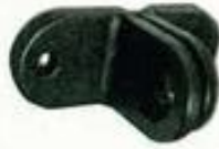
241151 Gancho de la carcasa.