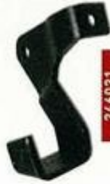
246021 Soporte cuchilla.