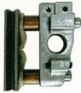
244011A Bloque guiador completo.