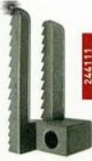
244111 Diente de arrastre.