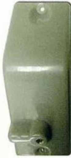
24514 Cubierta superior.