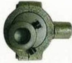
242011 Subensamblaje de la biela.