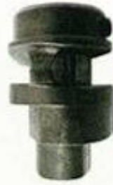
243012 Eje del engrazador.