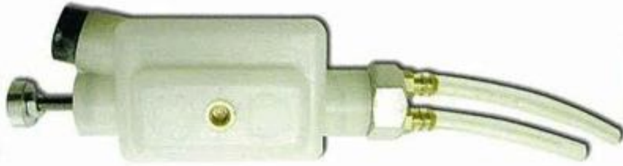
D03003 Depósito de aceite.