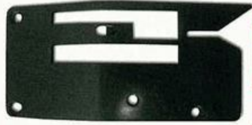
244122 Placa de aguja.